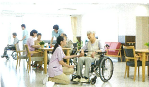
空中浮遊物の除菌 室内全体の消臭

次亜塩素酸系除菌・消臭剤です。水に溶かすと超強力な除菌力を持つ次亜塩素酸水になり、速やかに除菌消臭成分である次亜塩素酸 (HClO) を生成します。有効成分は、ジクロロイソシアヌル酸ナトリウムで、同濃度の次亜塩素酸ナトリウムの8倍以上の除菌力があります。