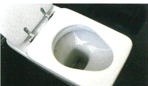
トイレ・便器の 除菌・消臭