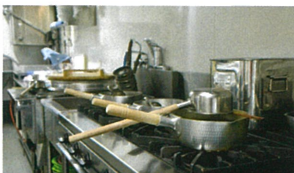
調理器具等の洗浄除菌