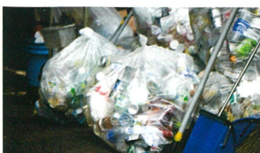
生ゴミの除菌・消臭