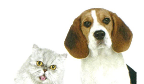
ペット排泄物の除菌・消臭 吐しゃ物処理