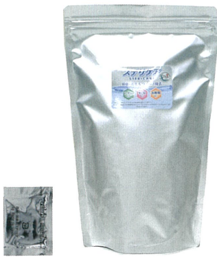
1包(1g) 顆粒・粉末 / 100包入