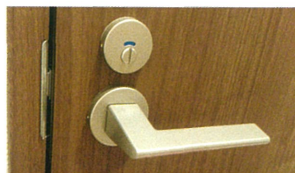
床・ドアノブの 強力除菌・消臭