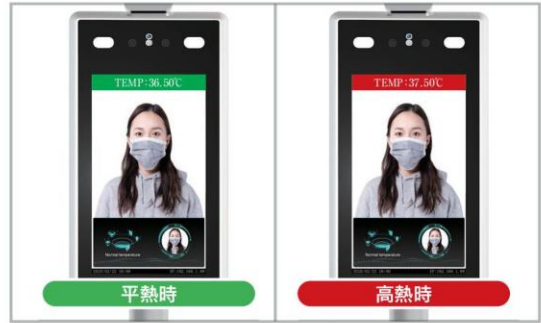
※画像は「NSAC-TH1001」製品の表示となります。

※体表面温度測定のみでの使用もできます ※表面温度分布を測定する機器ですが、体温計等の医療機器ではありません