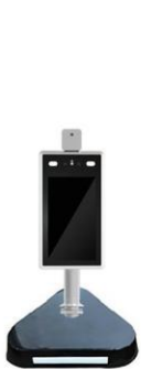
卓上スタンド(別売) H38×W260×D283mm